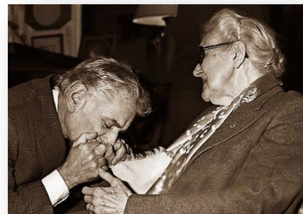
Leonard Bernstein i Nadia Boulanger, 1978. u njenom stanu nakon što mu je dodijelila Ordre National de la Légion d'honneur

Nakon toga nastavlja obrazovanje kod čuvene Nadia Boulanger (1887. – 1979.) koja ga usmjerava na Ravelovu orkestraciju i prihvaćanje Brazilskoga glazbenog naslijeđa . Nadia Boulanger bila je francuska skladateljica, dirigentica, a iznad svega glazbena učiteljica i savjetnica koja je obrazovala generacije vodećih skladatelja 20. stoljeća. Osim skladatelja; obrazovala je soliste, aranžere i dirigente među kojima su najpoznatiji neoklasicisti – Harold Shapero, Irving Fine, Alexei Haieff, John La Montaine, Igor Stravinsky, Daniela Berenboim, Philip Glass ; ali i jazz glazbenike Quincyja Jonesa, Donalda Byrda, Gigi Brycea te čuvenoga argentinskog skladatelja Astora Piazzollu . Pored toga, predavala je na glazbenim akademijama Juilliard, Yehudi Menuhin, Royal College of Music i Royal Academy of Music . Boulanger je bila prva žena koja je dirigirala najpoznatijim orkestrima poput BBC Symphony, Boston Symphony, Hallé, New York Philharmonic i Philadelphia orchestra , a dirigirala je praizvedbama Coplandovih i Stravinskyjevih djela.