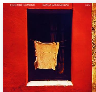
Egberto Gismonti - Dança das Cabeças (Ples glava)

perkusionistom Naná Vasconcelosom (1944 – 2016) . U roku od samo 3 dana u Talent Studiju u Oslu trebali su snimiti album pa je stoga predložio Vasconcelosu da napravi koncept temeljen na premisi kojom bi glazbeno izrazili zajedničku povijest i kulturno naslijeđe. Nastala je priča o dva dječaka koji lutaju gustom, vlažnom prašumom: punom životinja i insekata. Međutim, ne hodaju jedan pored drugog, nego su udaljeni tako da jedan drugom vide samo glavu. Na toj je premisi nastao album Dança das Cabeças (Ples glava) koji je primio veći broj kontroverznih nagrada . U Engleskoj je nagrađen kao pop glazba , a u Americi je dobio dvije nagrade: za folklor i jazz , dok je u Njemačkoj album nagrađen u kategoriji klasične glazbe . Kako je moguće skladati tako čarobnu i zavodljivu glazbu i u čemu je njena tajna? Kojim riječima možemo opisati Gismontijevu glazbu? Ovaj članak će nam u tome pomoći.