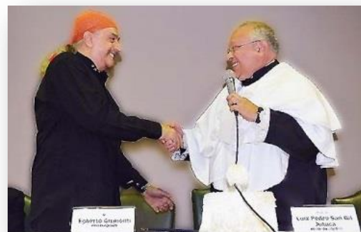
Egberto Gismonti prima počasni doktorat titulu de Doutor Honoris Causa da UNIRIO por Comunicacao 2017. godine

Njegov rad na najbolji mogući način izražava glazbene raznolikosti Brazila . Od batuquea i plesnih rituala Xingu Indijanaca do Carioca sambe i choroa , kroz sjeveroistočni frevo , baião i forró , Gismonti najdublje zahvaća u istinsku bit brazilskog duha. To radi uzvišeno, istovremeno na najprimitivniji i najsofisticiraniji način, reflektirajući osobne vizije oplemenjene godinama klasične naobrazbe i glazbene pismenosti u bogatstvo glazbenog izričaja. Iskusnom se uhu čini kako je sinkretizam odgovor na pitanje postavljeno na početku ovog članka. Možda je to jedan od razloga zbog kojeg je Egberto Gismonti za svoj doprinos kulturi primio počasni doktorat 8.11.2017.